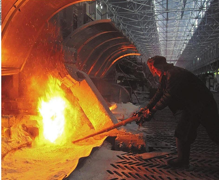
BELİRSİZLİK VAR İSMMMÖ’nun hazırladığı raporda, kamuoyunda işyeri sahibi herkesin özellikle de az tehlikeli işlerde 50 ve altında çalışan istihdam eden işverenlerin çeşitli endişelere sahip olduğu ve ne yapılacağı konusundaki belirsizlikten yakındıkları dile getirildi.