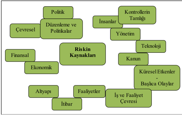
Şekil 1: Riskin Kaynakları

Riskler çok çeşitli sebeplerden ortaya çıkmakta olup aşağıdaki şekilde riskin kaynakları ve kaynakların birbirleriyle olan ilişkisine yer verilmektedir.