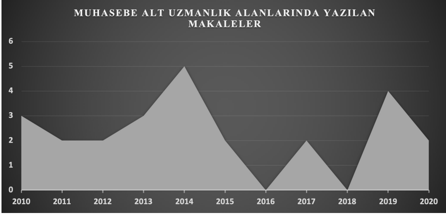
Grafik 1. Muhasebe Alt Uzmanlık Alanlarında Yazılan Makalelerin Yıllar İtibariyle Dağılımı

Muhasebe alt uzmanlık alanlarında yazılan makalelerin içerik açısından dağılımı kategorisinde ise, gerçeğe uygun değer muhasebesi, karbon muhasebesi, dış ticaret işlemleri muhasebesi, adli muhasebe, yalın muhasebe, inşaat muhasebesi, kaynak tüketim muhasebesi, mali muhasebe ve mali mühendislik, kriz muhasebesi, yaratıcı muhasebe, sorumluluk muhasebesi, tasfiye işlemleri muhasebesi, mental muhasebe, hatır işlemleri muhasebesi, hasarlı araç muhasebesi vb. gibi spesifik konular yer almaktadır.